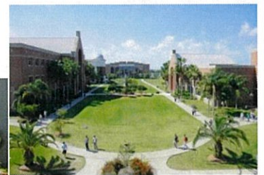
↑フロリダ工科大学キャンパス

ELS Melbourne校があるキャンパスは、フロリダの美しいビーチから数分の距離にあり、トロピカルガーデンやヤシの木々に囲まれたリラックスした雰囲気の中で勉強ができます。中心市街地までは車で約15分程度の場所にあります。