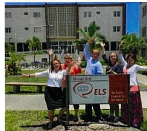
←語学学校スタッフ