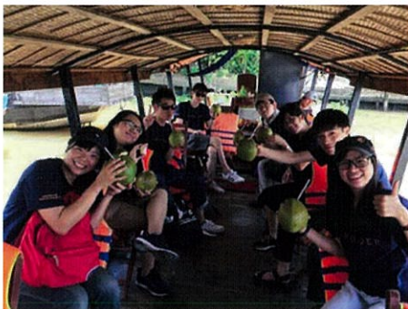
フリータイムもバディと一緒に過ごします