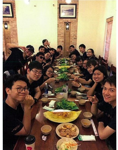
バディと一緒に人気のベトナム料理店へ

研修費用(予定)： 34万円 ※国内空港旅客取扱施設利用料、国際観光旅客税、燃油サーチャージ、海外空港税、海外旅行保険料が別途必要です。 パスポート残存有効期間： 入国時6か月以上 査証： 不要 ※日本以外の国籍や研修前にベトナムに渡航予定のある方は、事前に査証申請が必要です。 ・日程表のフライトスケジュールは日本航空を利用した場合の2020年2月現在有効な参考時刻です。航空会社の都合により、変更になることがあります。 ・研修期間中の現地の諸事情や研修先および手配機関の都合により、研修内容の変更や訪問先の順番が入れ替わることがあります。 ・会社訪問は受入機関の業務の都合により、訪問先および内容が急遽変更になることがあります。