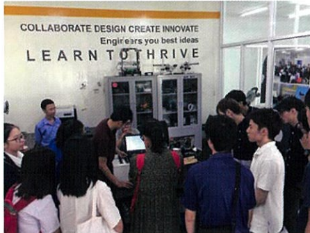
企業訪問では英語で質疑応答に挑戦