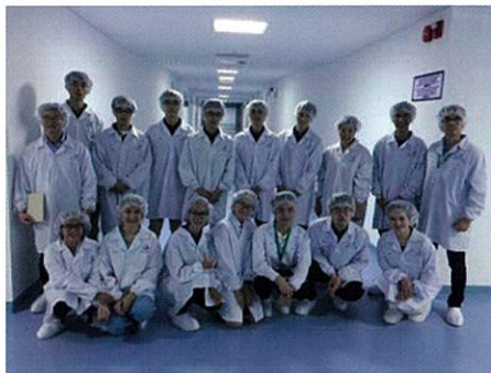
地元のさまざまな分野の企業を訪問