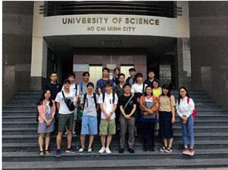
ベトナムの国立大学のキャンパスで研修

「このプログラムに参加して、自分自身が成長することができたと思うし、参加しなければ知り合うことのなかった他学部の人や海外の人と友人になれることができました。」 「日本にいたらわからないこと、例えば海外の学生の様子、海外の良さ、日本の良さなどが知れてとてもいい経験になりました。」 「世界の友達ができる、自分の知らない世界を知ることができる、自分に足りないものに気がつくことができる、これからの大学生活で身につけなければいけないスキルを見つけ出せるから。」 「サポートが手厚いので、今まで海外を経験したことがない人、海外に興味があるが不安な人などにおすすめです。」 「授業で行ったプレゼンは、大学でも役に立つと思います。」 「ベトナムの人は優しい人が多いし、海外に友達を作るきっかけになるから。」