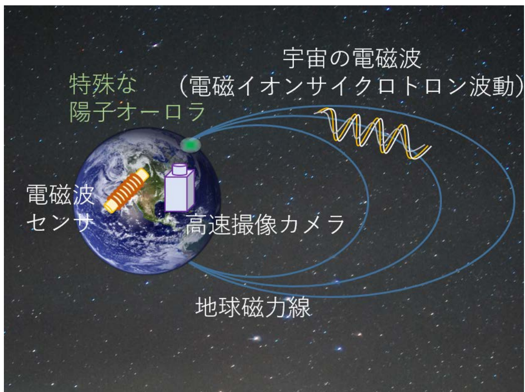
図2. 陽子オーロラと電磁イオンサイクロトロン波動の観測イメージ

宇宙で発生した電磁イオンサイクロトロン波動は磁力線に沿って伝搬する性質を持っており、地上からも電磁波センサによって観測することが可能です。しかし、電磁イオンサイクロトロン波動は地磁気の数万分の一程度の微弱なものであり、地上観測は容易ではありません。同じく陽子オーロラも通常の電子オーロラに比べて暗く、観測は容易ではありませんでした。今回、EM-CCDカメラによる画像データと、通常的信号解析よりも時間変化をより詳しく調べることができる Stockwell 変換を電磁波とオーロラデータに用いることにより、陽子オーロラが電磁イオンサイクロトロン波動と同じ周期で高速に明滅していることの発見に成功しました。